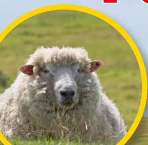
Schäfchen zählen... ... macht vielen Deich-Flaneuren Spaß

Erholung ahoi! Nur ein paar Schritte von der Nordsee entfernt, wartet dieses Refugium auf Sie